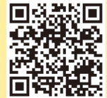
2023년 사회조사 안내