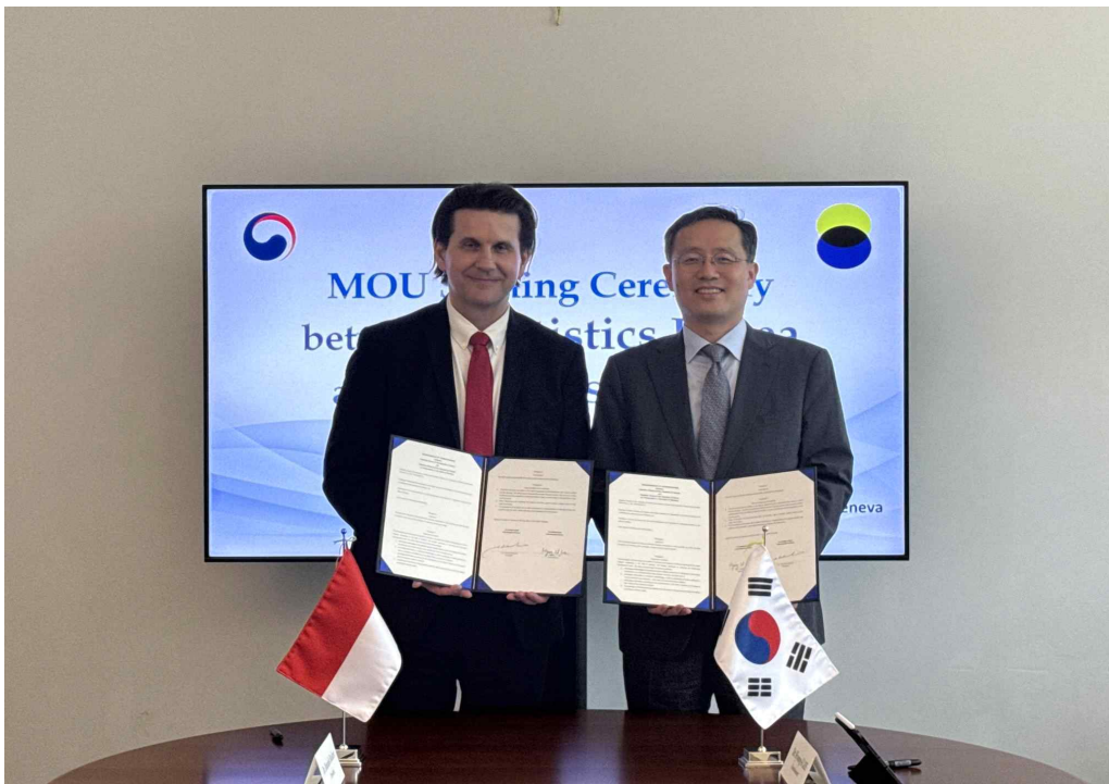
한-폴란드 통계청 통계협력 업무협약(MOU) 체결