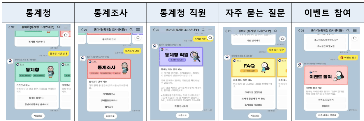
<그림> 『SI 통계조사 안내봇』 제공 서비스