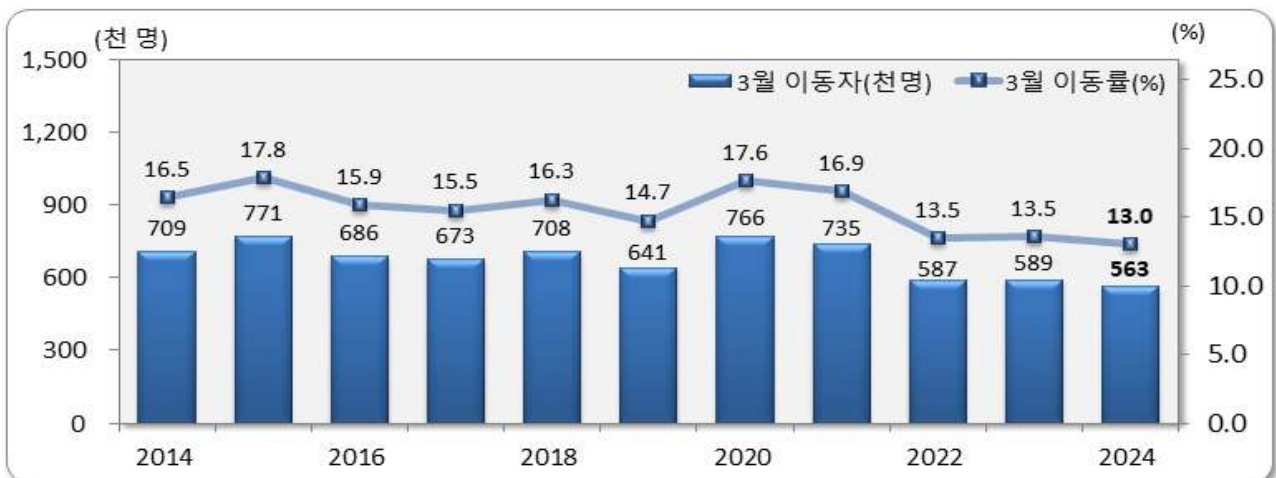
[그림 1] 전국 3월 인구이동